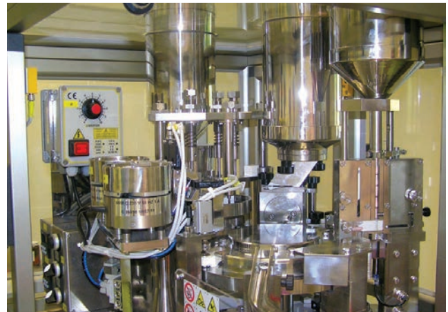
In-Cap kapszulatöltő gép minitabletták adagolásával az egyik hazai gyógyszergyárban

Az In-Cap automata kapszulatöltő működését tekintve a nagy sebességű, ipari méretű kapszulatöltőkkel egyezik meg, de azoknál kisebb méretű és teljesítményű. Segítségével gyakorlatilag mindenféle homogén töltetű és kombinációs készítmények kifejleszthetők és gyárthatók. Így pl. tölthető a kapszulába por, pellet, minitabletta, folyadék és mindezek kombinációi.