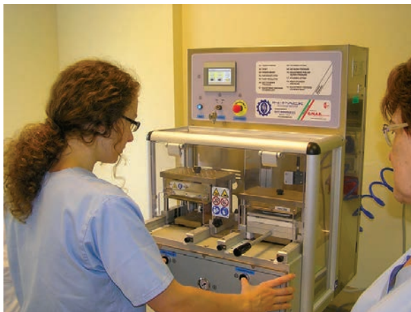
In-Pack bliszterező gép egy hazai gyógyszergyárban

A tabletták és kapszulák bliszterbe történő elsődleges csomagolását az In-Pack típusú félautomata bliszterező gép teszi lehetővé, amellyel különböző anyagú fóliákból készülő blisztercsomagolású készítmények gyárthatók.